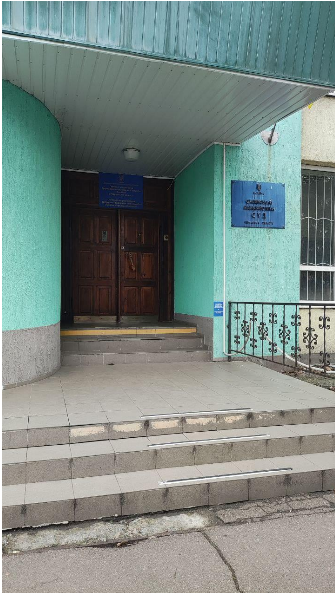
фото 6 (друге приміщення)