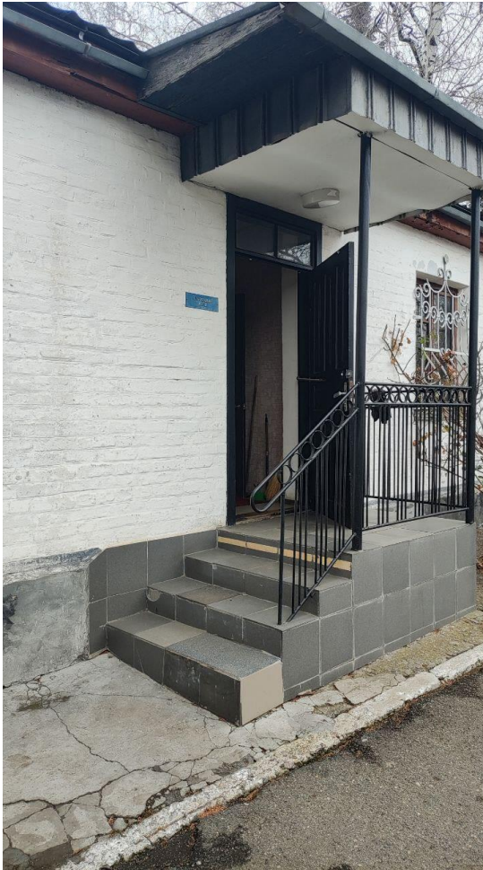
фото 1 (перше приміщення)