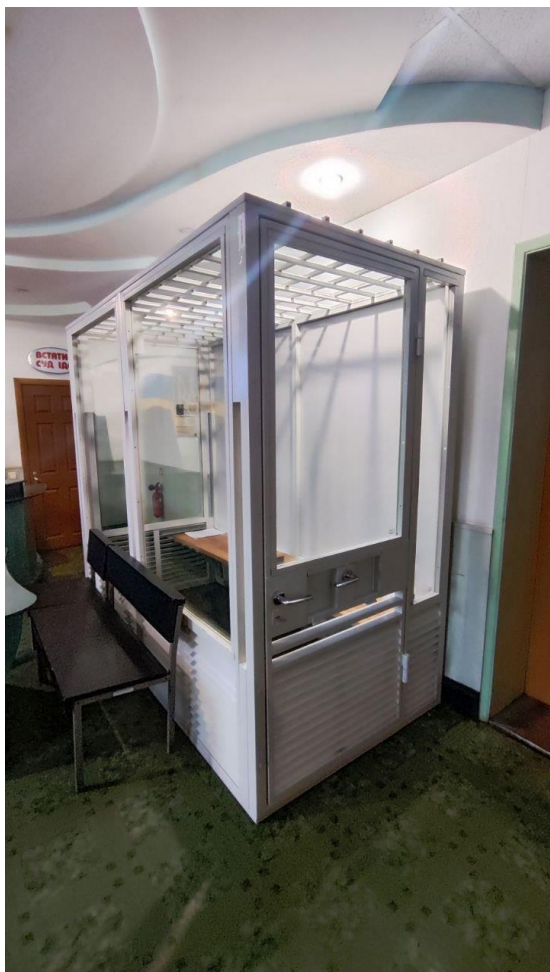
фото 3 (перше приміщення)