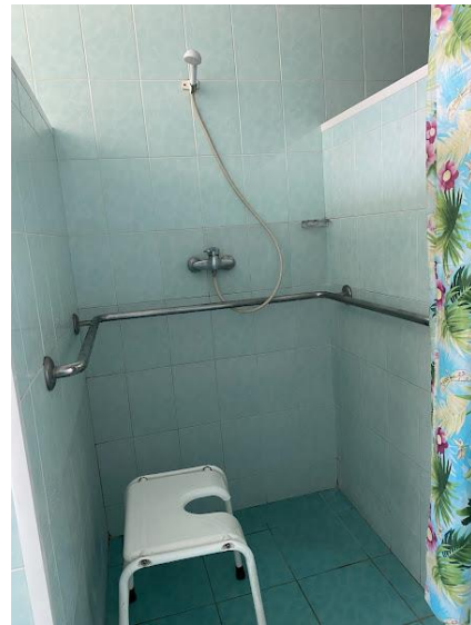
Φοτο Νο 10