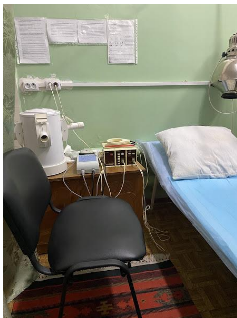
Фото № 5