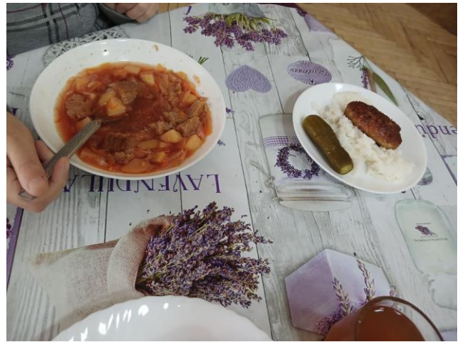
Φοτο Νο 8