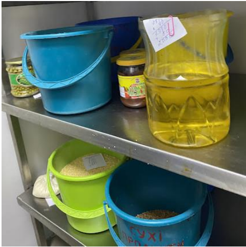
Φοτο Νο 7