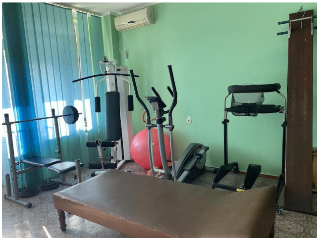
Φοτο Νο 11