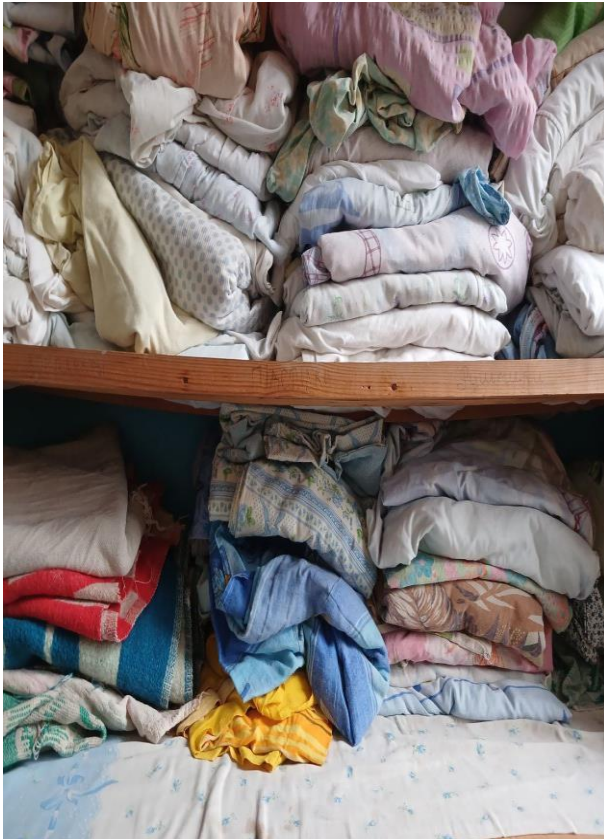
Фото № 9