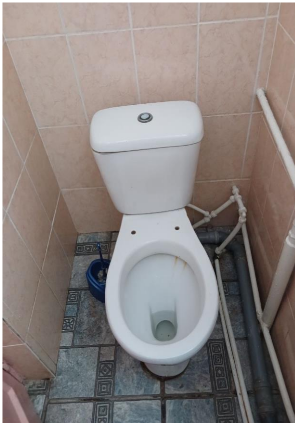
Φοτο № 7