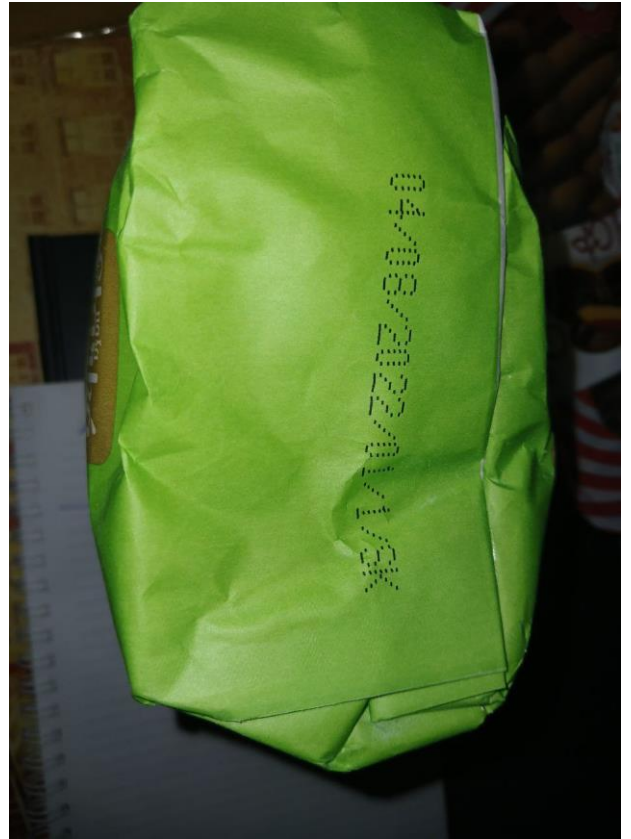
Φοτο № 6