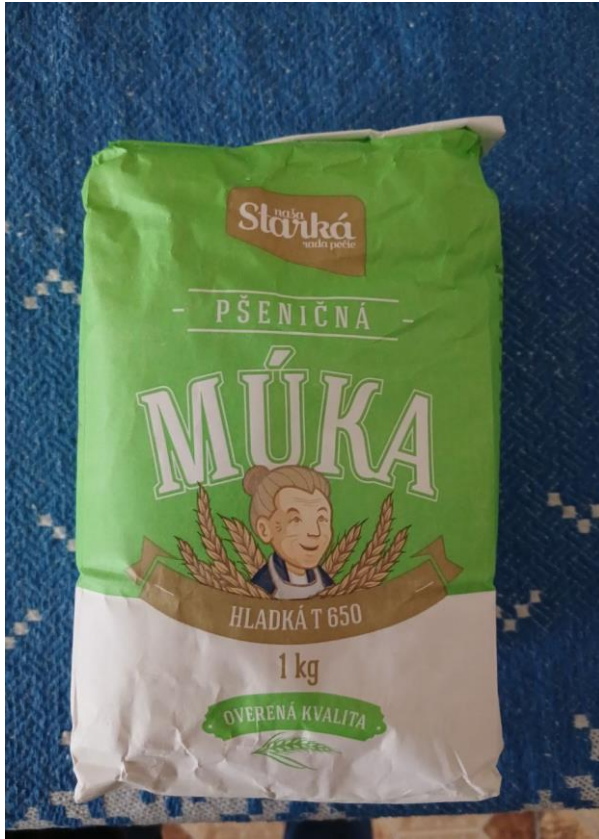
Φοτο № 5