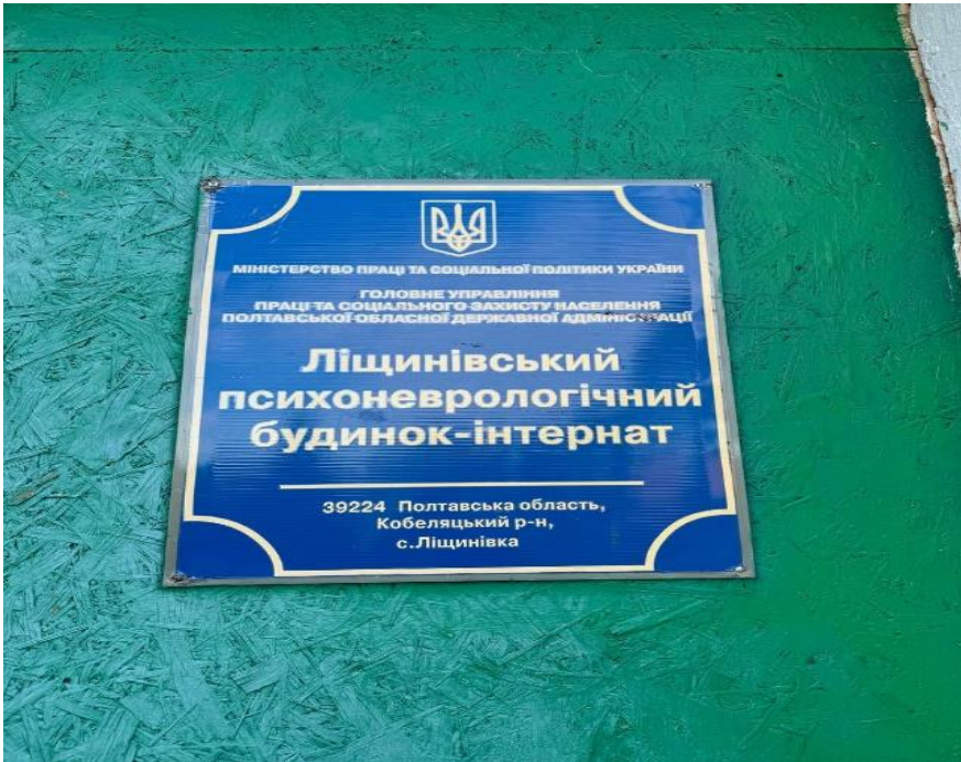
Фото з відвідування: