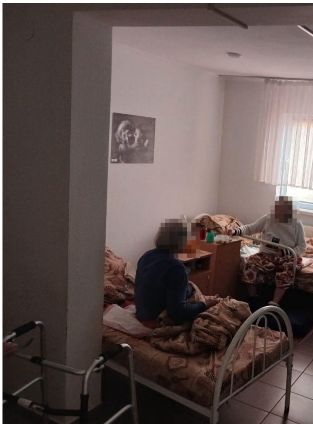
Φοτο Νο 7