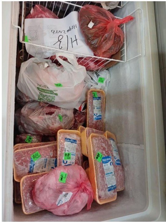
Φοτο Νο 5