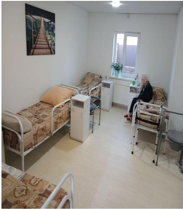
Φοτο № 9