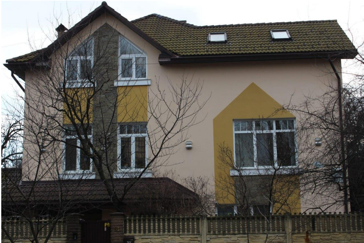
Фото 2