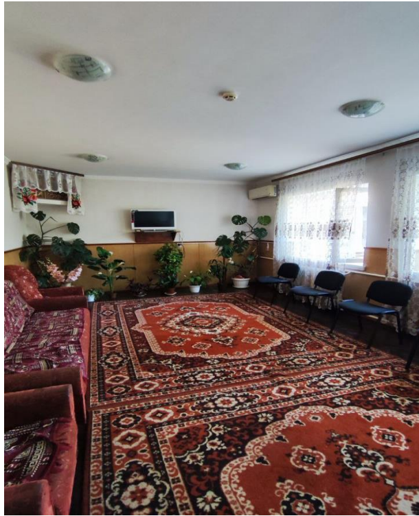
Φοτο Νο 1