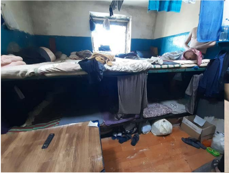
фото 1 фото 2