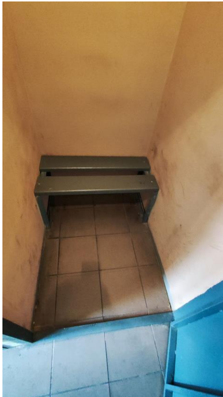
Φοτο № 10