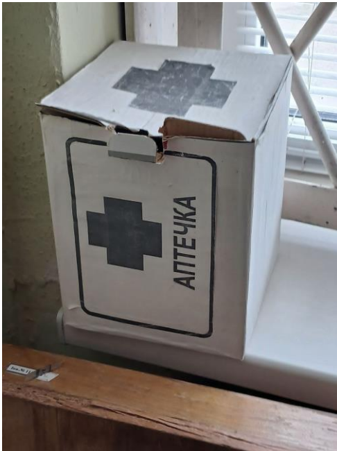
Фото № 6