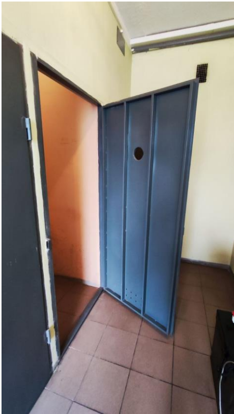
Φοτο № 9