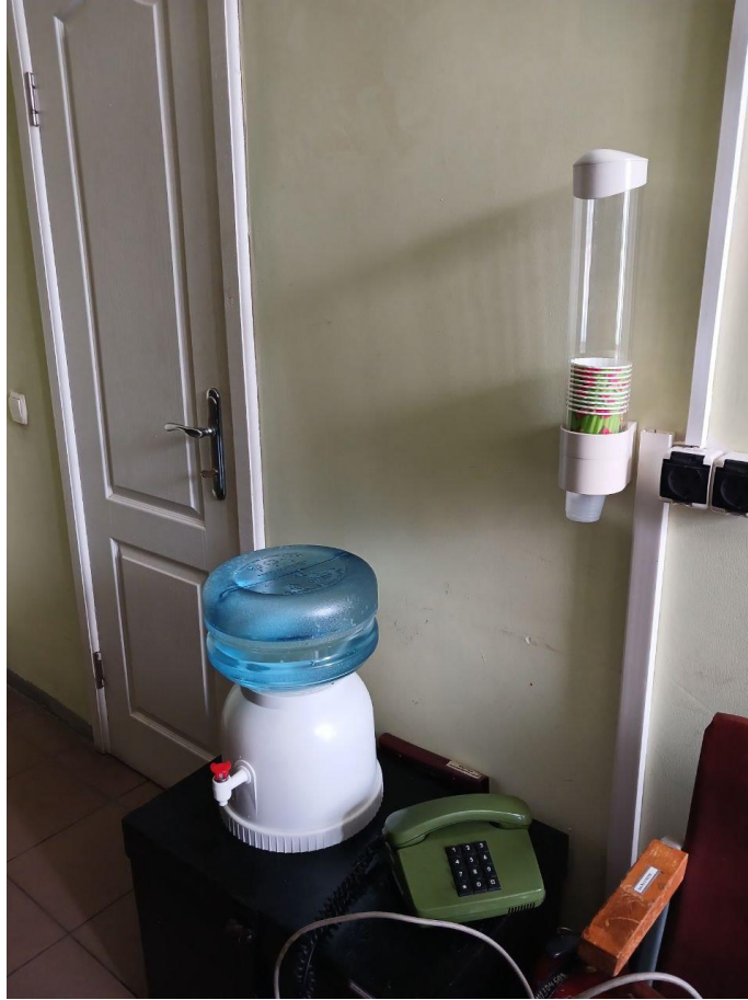
Φοτο № 8