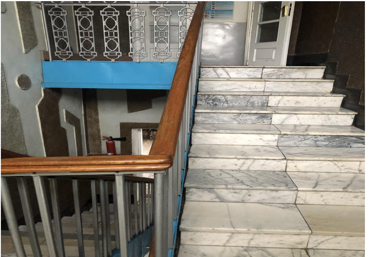
Фото 7 і 8