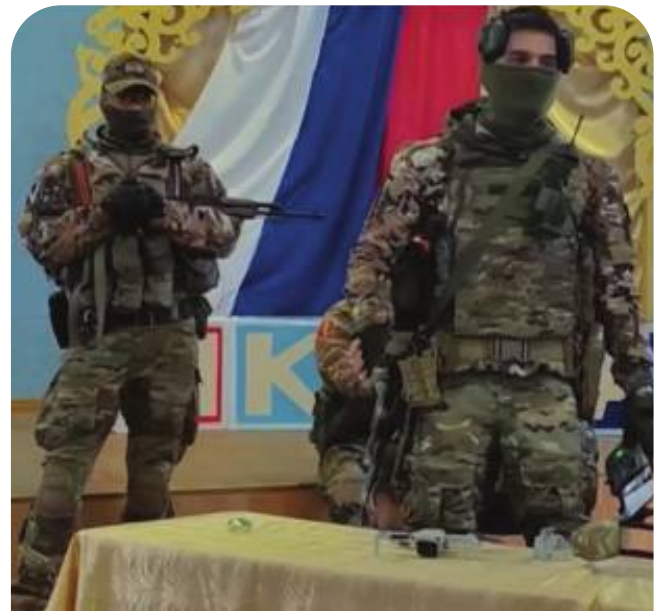
Урок мужності на тимчасово окупованій території Херсонської області

! Росія спочатку залишає українських дітей без сімей, а потім грається «У РЯТУВАЛЬНИКІВ»