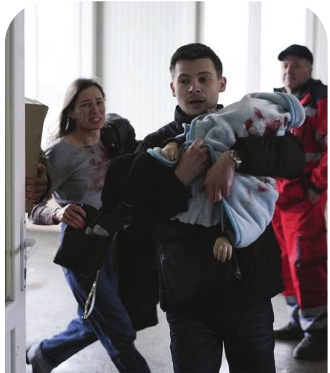
18-місячний хлопчик помер від поранення внаслідок обстрілів Маріуполя

! За вчинення воєнних злочинів, геноциду не має строку давності притягнення до відповідальності. Особливістю цих злочинів є те, що відповідальність за їх вчинення несуть конкретні особи, які віддають накази вчинити такі злочинні дії.