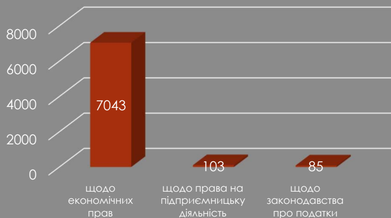
Кількість звернень, з березня 2020 року

Від початку встановлення карантинних обмежень до Уповноваженого зверталися громадяни щодо: